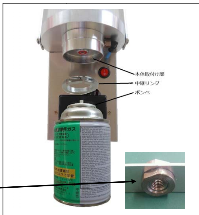
ボンベ取り付け部及び取付ねじ